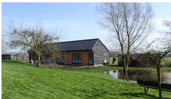
Nieuwe huisvesting voor begeleid wonen

Wil je meer weten neem dan gerust contact met me op.